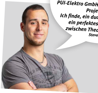
INGENIEUR FÜR ELEKTROTECHNIK/ AUTOMATISIERUNGSTECHNIK (BACHELOR OF ENGINEERING)