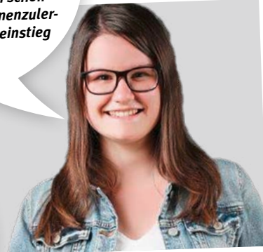
MASCHINENBAUINGENIEURIN (BACHELOR OF ENGINEERING)

„Ich habe meinen Abschluss als Ingenieur im Studiengang Elektrotechnik/Automatisierungstechnik gemacht und arbeite seitdem bei der Firma PUI-Elektro GmbH in Gera als Bau- und Projektleiter.